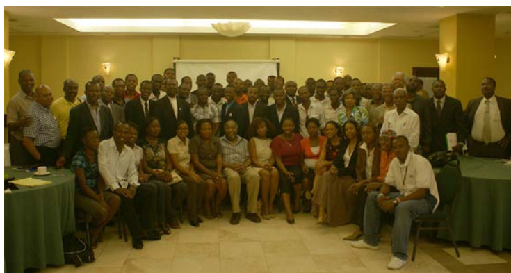
Réunion des Chapitres de GRAHN-Haïti, avril 2013

Une double leçon découle de l'expérience de cinq ans de fonctionnement du GRAHN en Haïti et dans le monde (en plus de celles citées plus haut, d'autres branches ont aussi émergé en République dominicaine, en Suisse et au Sénégal). D'abord, GRAHN-Monde doit éviter de disperser son action, surtout que la moisson est abondante et les ouvriers, peu nombreux. Mieux vaut concentrer notre énergie à maintenir la dynamique actuelle en consolidant les acquis majeurs. Ensuite, il n'est pas chose aisée de coopter des compatriotes et de les mobiliser en vue de la création d'un chapitre dont l'objectif est d'inviter les membres à se donner le souffle nécessaire pour poursuivre, sur la durée et avec un désintéressement total, l'objectif d'une Haïti nouvelle qui, par définition, ne se fera évidente que dans le long terme.